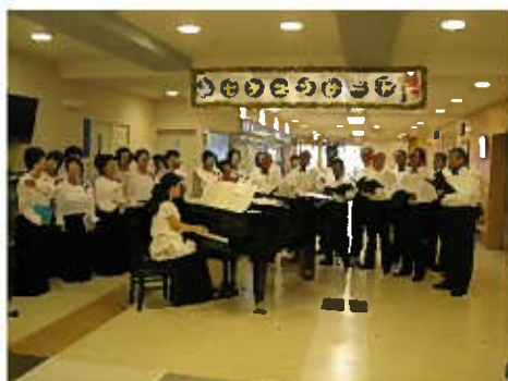
美しいハーモニーが会場全体をつつみました