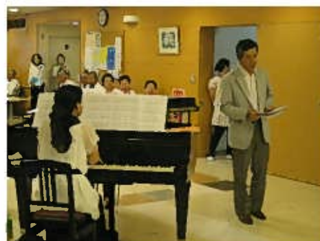
フロア顔負けの美声を披露

七夕コンサートを企画・運営しました・・・ 当院の「サービス向上委員会」の職員です。