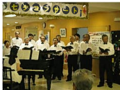
男性合唱「鼓勇」の力強い声