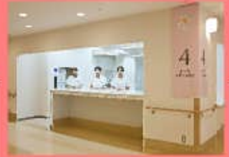
ナースステーション