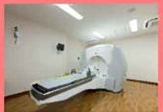
ガンマナイフパーフェクション