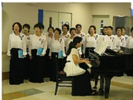
女性合唱「花袖」の方々の美声

入院・外来患者様とご家族で、100名を超える多くの方々の参加となりました。「たなばたさま」「みかんの花咲く丘」等をみんなで合唱して「笹の葉さ~らさら~♪」と一緒に大きな声で歌う方や、感動して涙ぐむ方なども見受けられ、大盛況で幕を閉じました。