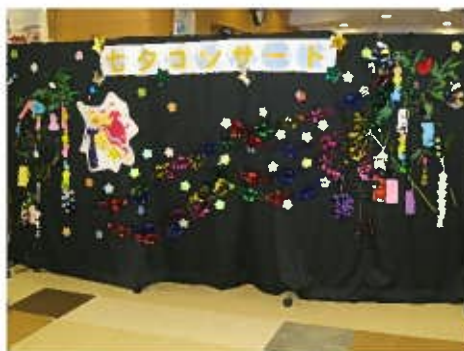
職員の手作りの七夕飾り