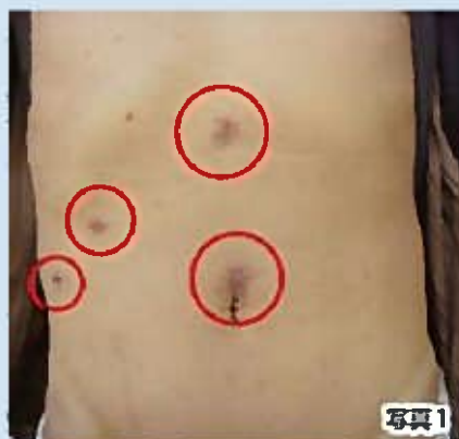
(腹腔鏡下胆のう摘出)

当院では、患者様の苦痛を少しでも軽減できるよう、また内視鏡外科分野のひとつの選択肢として、2009年8月からこの術式を取り入れています。詳しくは、当院外科外来までお尋ね下さい。